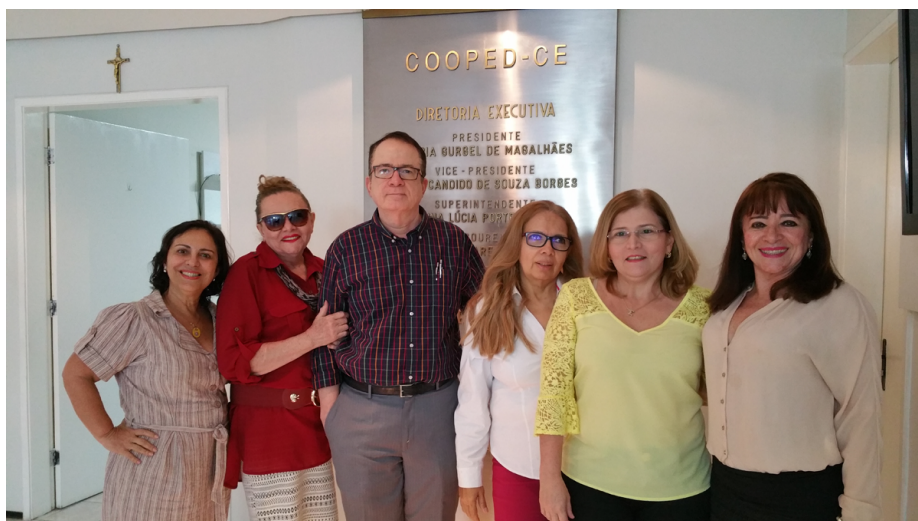
Conselho Fiscal - 2015 - 2016

O desejo de mudança nasce do desejo de fazer ainda melhor pela criança cearense! Sigamos!